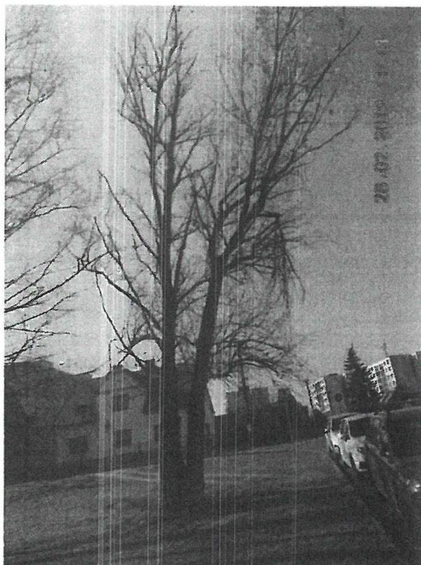
Horymírova x Markova, Č. 2 Salix alba , 136, 162, 122 cm