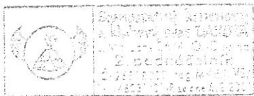
Bc. Kateřina Hoghová 2. podnáčelník, statutární zástupce