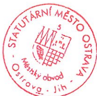
za poskytovatele Bc. Martin Bednář starosta

KNIHOVNA!!! 10 Knihovna města Ostravy príspevková organizace ul. 28. října 2, 702 00 Ostrava IČ: 000 97 586