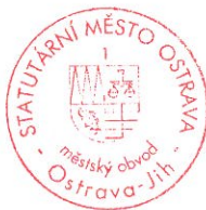
za půjčitele Bc. Martin Bednář starosta městského obvodu Ostrava-Jih