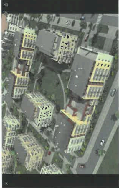
Bytový soubor Nove Medlanky v Brně. Realizace Orco Property Group. 8. října 2021, 11:27:11