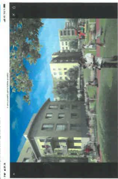
Bytový soubor Amerika 1 v Praze. Realizace Orco Property Group. 7. října 2021, 14:27:11