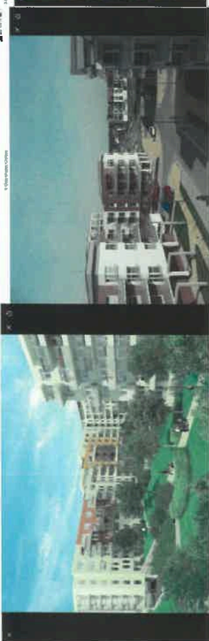
Bytový soubor Amerika 1 v Praze. Realizace Orco Property Group. 7. října 2021, 14:27:11