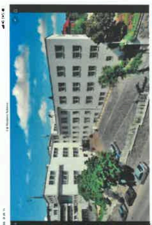
Bytový soubor Amerika 1 v Praze. Realizace Orco Property Group. 7. října 2021, 14:27:11