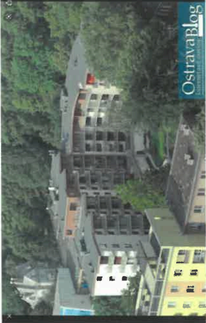
Bytový soubor Amerika 1 v Praze. Realizace Orco Property Group. 7. října 2021, 14:27:11