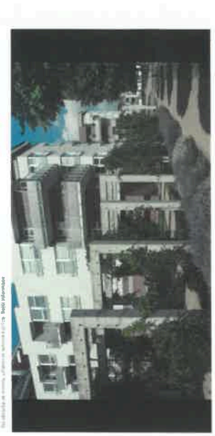
Bytový soubor Amerika 1 v Praze. Realizace Orco Property Group. 7. října 2021, 14:27:11